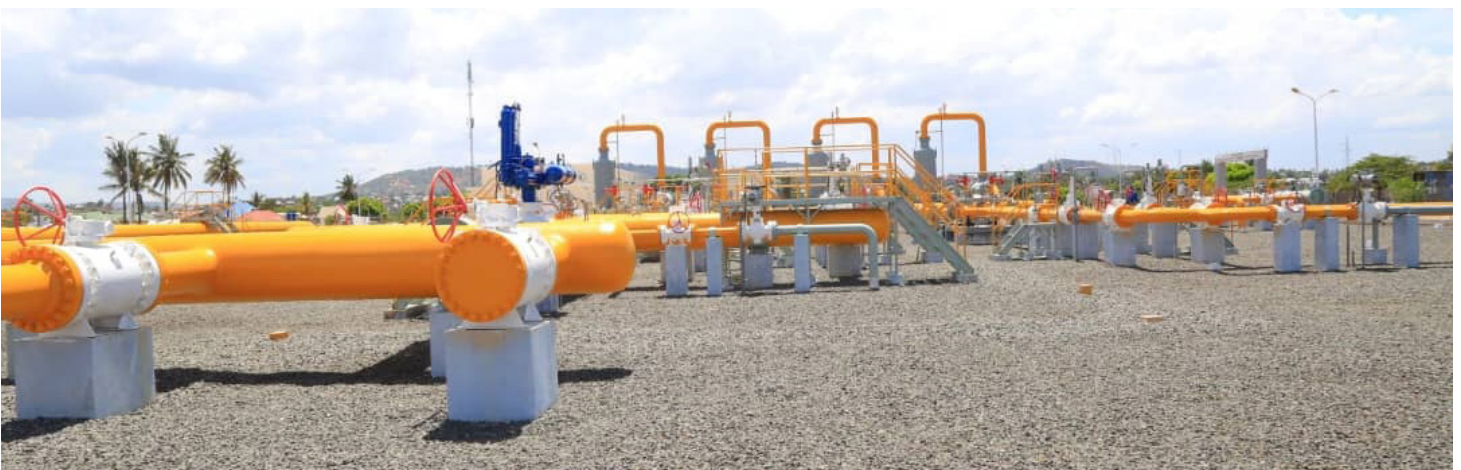
Muonekano wa miundombinu ya kusafirisha Gesi asilia katika kituo cha Kinyerezi kilichopo Jijini Dar es Salaam.