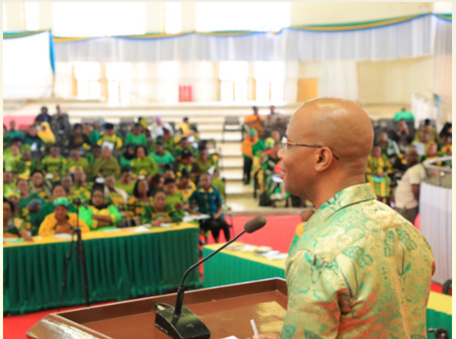
Waziri wa Nishati, Mhe. January akitoa elimu ya nishati safi ya kupikia kwa Wajumbe wa Baraza Kuu la Umoja wa Wanawake Tanzania (UWT) pamoja na Wenyeviti na Makatibu wa UWT wa Mikoa na Wilaya, Machi 21, 2023 jijini Dodoma.