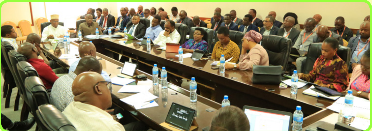
Wajumbe wa Kamati ya kudumu ya Bunge ya Nishati na Madini pamoja na Watendaji walio Shiriki kikao cha kujadili taarifa ya utekelezaji wa Bajeti ya Wizara ya Nishati kwa kipindi cha mwaka 2022/2023.