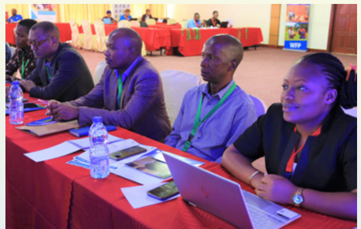
Wataalam kutoka Wizara ya Nishati, wakiwa katika kongamano la Nishati Safi ya Kupikia lililofanyika jijini Dodoma ambalo lilihusisha wadau mbalimbali zikiwemo Taasisi za Serikali na Wadau wa Maendeleo.