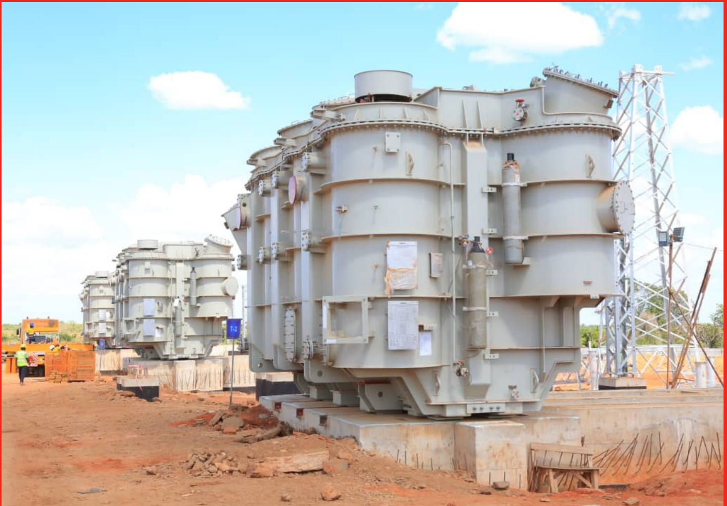
Muonekano wa Ujenzi wa Kituo cha kupoza umeme cha Chalinze pamoja na baadhi ya Miundombinu ikiwemo mashine umba (Transfoma), zitakazotumika katika ujenzi wa mradi huo.