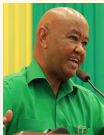
Makamu Mwenyekiti wa Chama cha Mapinduzi (CCM), Tanzania Bara, Ndg. Abdulrahman Kinana akizungumza na Wajumbe wa Baraza Kuu la Umoja wa Wanawake Tanzania (UWT) pamoja na Wenyeviti na Makatibu wa UWT wa Mikoa na Wilaya, Machi 21, 2023 jijini Dodoma.