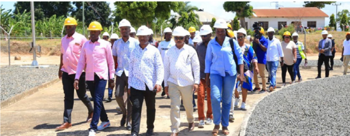
Wajumbe wa Kamati ya Kudumu ya Bunge ya Nishati na Madini wakiwa na Watendaji mbalimbali kutoka Wizara ya Nishati pamoja na Shirika la Maendeleo ya Petrol Tanzania wakifanya ukaguzi wa miundombinu ya kusafirisha Gesi asilia.