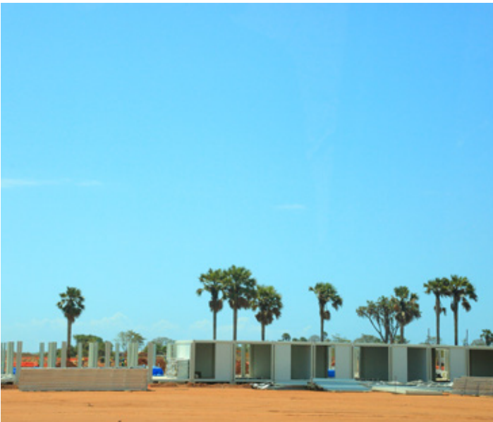
Baadhi ya Miundombinu inayoendelea kuwekezwa kwa ajili ya kuanza ujenzi wa Mradi wa Bomba la Mafuta Ghafi mkoani Tanga katika Kijiji cha Chongoleani.