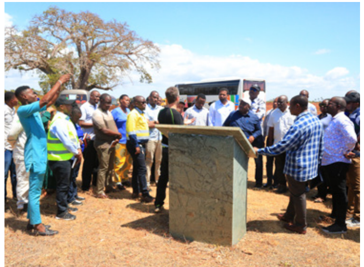
Wajumbe wa Kamati ya Kudumu ya Bunge ya Nishati na Madini wakiwa pamoja na watendaji mbalimbali kutoka Wizara ya Nishati na Shirika la Maendeleo ya Petroli Tanzania (TPDC) katika Kijiji cha Chongoleani mkoani Tanga, mahali lilipo jiwe la Msingi wa Mradi huo, Machi 16, 2023.