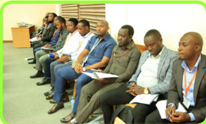
Baadhi ya watendaji wa Wizara ya Nishati na watendaji kutoka taasisi zilizopo chini ya Wizara walio Shiriki kikao cha kujadili taarifa ya utekelezaji wa Bajeti ya Wizara ya Nishati kwa kipindi cha mwaka 2022/2023.