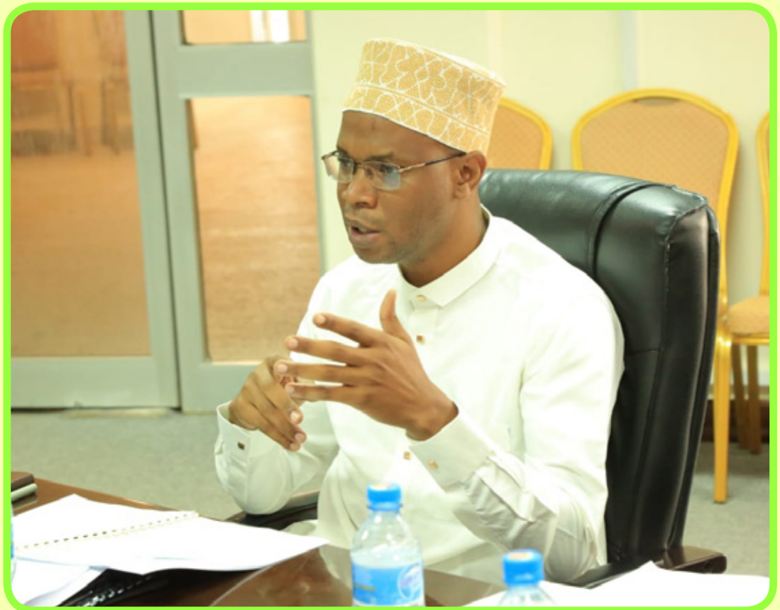
Waziri wa Nishati, January Makamba akizungumza jambo wakati wa uwasilishaji wa taarifa za utekelezaji wa Bajeti ya Wizara ya Nishati kwa kipindi cha mwaka 2022/2023 kwa wajumbe wa Kamati ya kudumu ya Bunge ya Nishati na Madini Machi 23, 2023 jijini Dodoma.