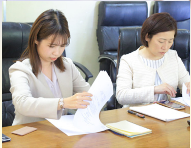
Watendaji kutosha Shirika la Maendeleo ya Kimataifa la Japan (JICA), wakiwa katika tukio la utiaji saina makubaliano ya utekelezaji wa Mradi wa kuhamasisha Matumizi ya Gesi Asilia kati ya Wizara ya Nishati na Shirika la Maendeleo ya Kimataifa la Japan (JICA).