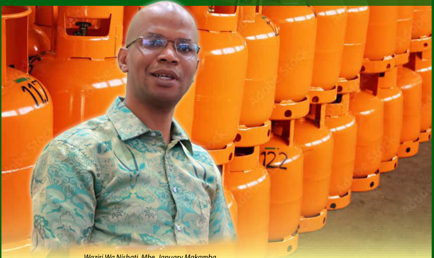
Waziri Wa Nishati, Mhe. January Makamba