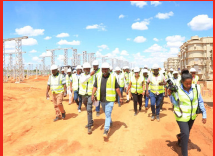
Wajumbe wa Kamati ya Kudumu ya Bunge ya Nishati na Madini, Watendaji kutoka Wizara ya Nishati pamoja na Shirika la Umeme Tanzania wakikagua ujenzi wa mradi wa njia ya kusafirisha umeme kutoka Bwawa la Julius Nyerere hadi Chalinze pamoja na Ujenzi wa Kituo cha kupoza umeme Chalinze.