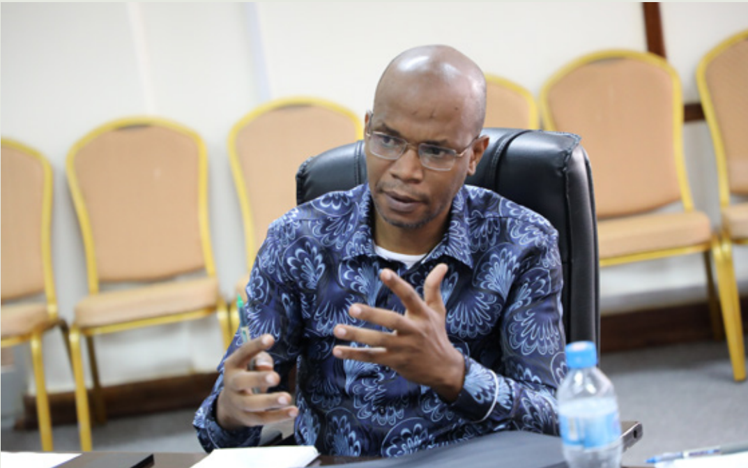
Waziri wa Nishati, Mhe. January Makamba (wa kwanza kushoto) akieleza jambo wakati Wizara ya Nishati ilipowasilisha taarifa ya utekezaji wa miradi mbalimbali kwa Wajumbe wa Kamati ya Kudumu ya Bunge ya Nishati na Madini jijini Dodoma.

Chalinze kwa wajumbe wa Kamati ya Kudumu ya Bunge ya Nishati na Madini jijini Dodoma.